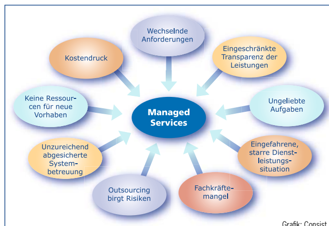
Typische Gründe für Managed Services